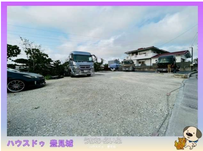
ハウズドゥ 豊見城 うちなーらいふ

7周年記念キャンペーン開催中！ 〇〇自己住宅物件、福祉施設建築可能(条件あり)〇〇人気の伊覇・東風平や糸満・南風原へのアクセスも良好です♪ 〇〇サンエー八重瀬シティ、八重瀬町役場近くでお仕事や子育てに利便性の良い立地です〇〇