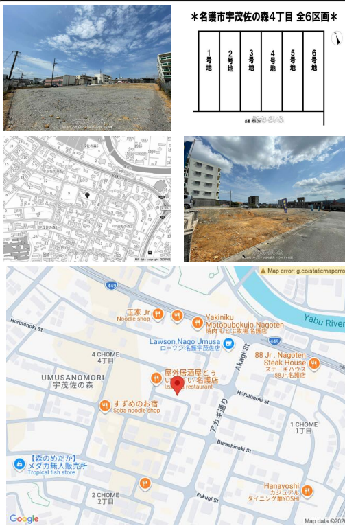
*名護市宇茂佐の森4丁目 全6区画*