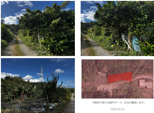
当物件の周りは畑やヤード、住宅が密集しています。