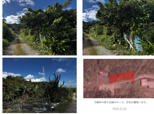
当物件の周りは畑やヤード、住宅が密集しています。