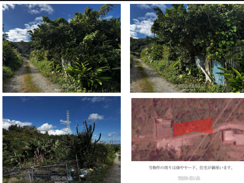
当物件の周りは畑やヤード、住宅が密集しています。