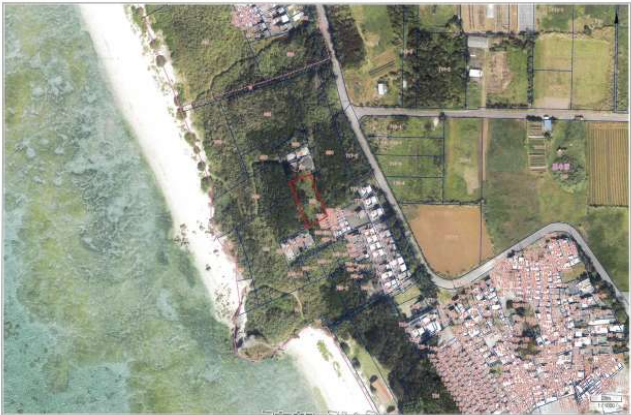
この写真は位置的なものを示すものであり権利関係には使用できません。