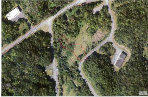
うちなーらいふ この画像は純粋に写真のみの表示です。権利関係には関係ありません。

【新着物件】人気の嘉手納弾薬庫に軍用地分譲スタート♪年間借地料102,118円～105,580円、倍率48倍です。弊社売主の為、仲介手数料は発生しないです！