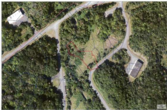
うちなーらいふ この画像は純粋利の表示です。権利関係には関係ありません。

【新着物件】人気の嘉手納弾薬庫に軍用地分譲スタート♪年間借地料102,118円～105,580円、倍率48倍です。弊社売主の為、仲介手数料は発生しないです！