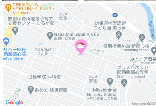
【バス停】安謝小学校入口／徒歩約2分