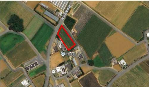
うちなーらいいふ

アパート、マンション、社宅等の【共同住宅用地】としてオススメですJ下地の入江湾の近くです☆シギラビーチまで車で10分、シギラベイクントリークラブ、エメラルドコーストゴルフリンクスまで車で10分圏内ですJ