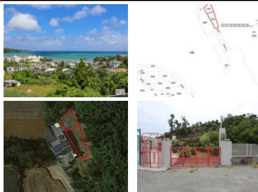
【バス停】与久田 / 徒歩約13分