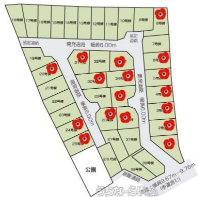
※図面と現況の相違は現況を優先します。