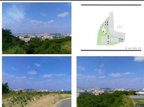
【バス停】阿波根 / 徒歩約12分