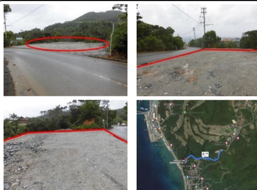
【バス停】崎本部より 1400m / 徒歩約22分