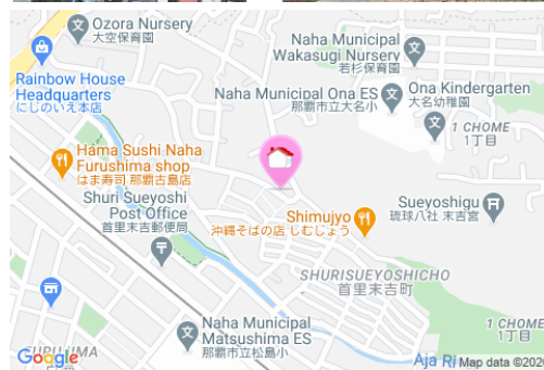
【モノレール】市立病院前駅／徒歩約8分