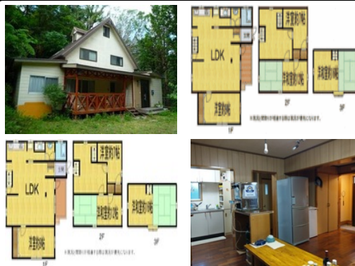
【バス停】許田／徒歩約15分