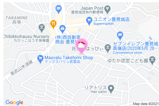
【バス停】武富 / 徒歩約4分