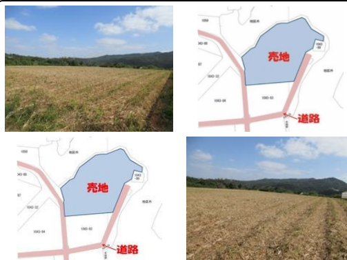
【バス停】ムーンビーチ / 徒歩約30分