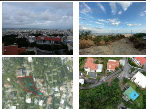
【バス停】高原／徒歩約10分