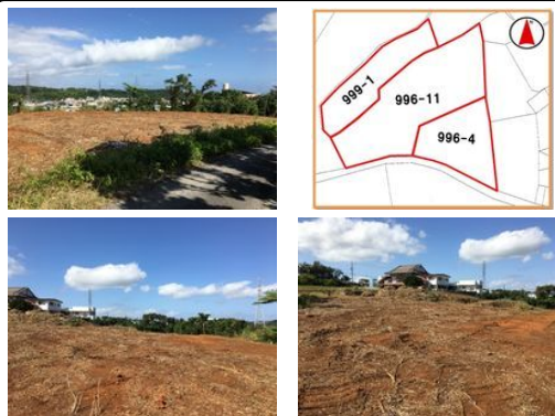
【バス停】後原 / 徒歩約4分