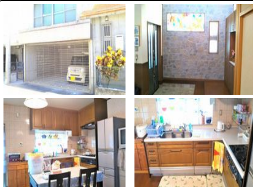
【バス停】アウトレットモール前／徒歩約8分