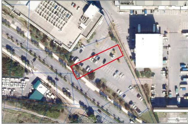
この図面は位置的なものを示すものであり権利関係には使用できません。