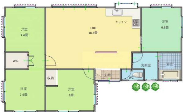
(Asahi House) うちなーらいふ ※現況と図面が異なる場合は、現況を優先します。

【オーナーチェンジ物件】海まで徒歩1分！長く続く海岸線と海と空がすぐそこに♪リフォーム済みできれいな室内。お庭もあります。退去後は自己使用も可能です。