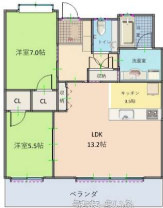
Tokurea rycom aqua terrace 503 ※現況と図面が異なる場合は、現況を優先します。

【ライカムエリア】【オーナーチェンジ物件】リビングからオーシャンビュー♪イオンモールや、高速インターなども近く便利な立地です！賃貸中の収益物件です。【家賃収入20万円/(月)】退去後は、自己使用も可能です。お気軽にお問い合わせください。