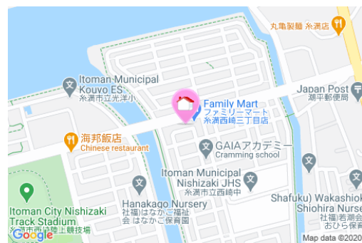
【バス停】西崎中学校入口／徒歩約3分