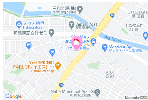
【バス停】安謝橋／徒歩約1分