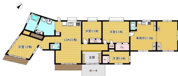
現況と間取り図が相違する際は、現況が優先されます。