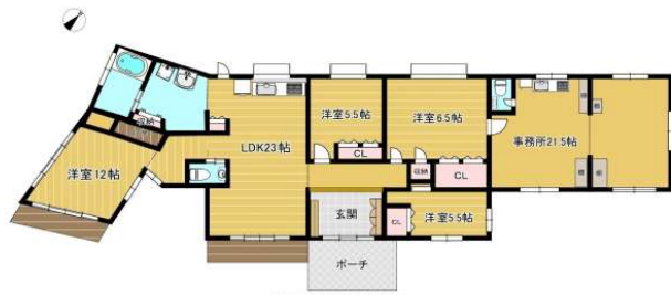
現況と間取り図が相違する際は、現況が優先されます。