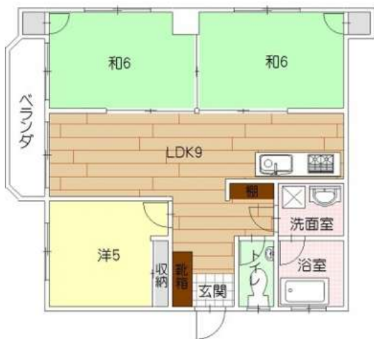
「ラ・フィーネヌーベル普天間702号室」

外壁塗装工事完了いたしました♪オーナーチェンジ物件！月額家賃60,000円・共益費2,000円で賃貸中！7階部分、景色良好！