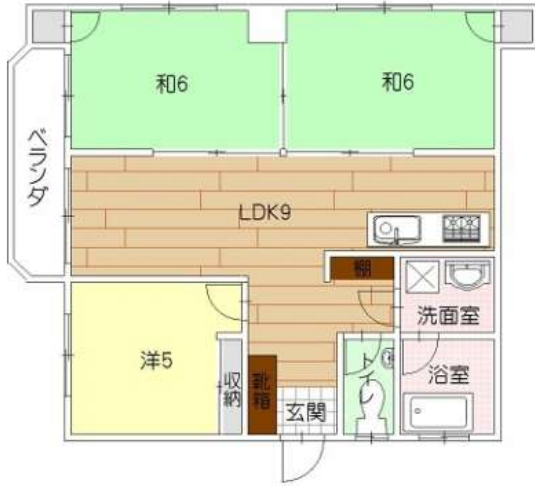
「ラ・フィーネヌーベル普天間702号室」

外壁塗装工事完了いたしました♪オーナーチェンジ物件！月額家賃60,000円・共益費2,000円で賃貸中！7階部分、景色良好！