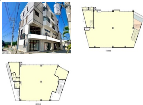
【バス停】真栄原／徒歩約2分