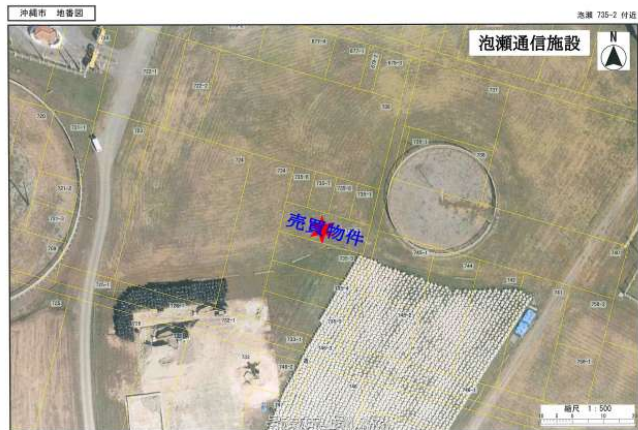
印刷実行ユーザー名：官車院家ユーザー この地図は市に提供された衛星写真のため、権利関係の確認に使用することはできません。 印刷日時：2025年02月18日 13時30分37秒