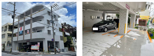
ルミエール・イリゼ契約駐車場 小型車専用 入居者専用

※1ヶ月分駐車料は、保証料込みで15,400円です。保証料は別途12,320円です。※1ヶ月分駐車料は、保証料込みで15,400円です。保証料は別途12,320円です。