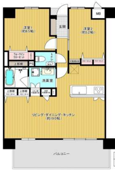
※築年につき、標準の多少適合は保証できません。