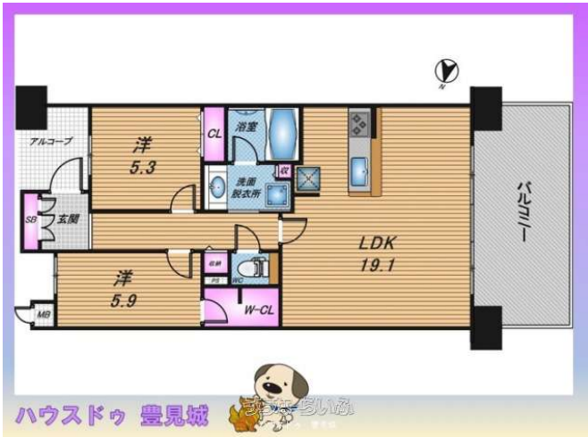
ハウストゥ 豊見城

セカンドハウスにピッタリな2LDK + 落ち着いたあるラウンジがあなたをお出迎え♪ ここ豊崎で疲れた体と心を解き放きまったりとしたうちなータイムを体感ください 解放感のあるリビングからは豊崎の街並みをお楽しみいただけます。