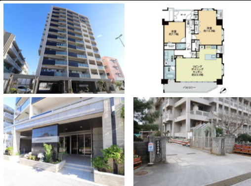
【バス停】市営伊佐住宅前／徒歩約1分