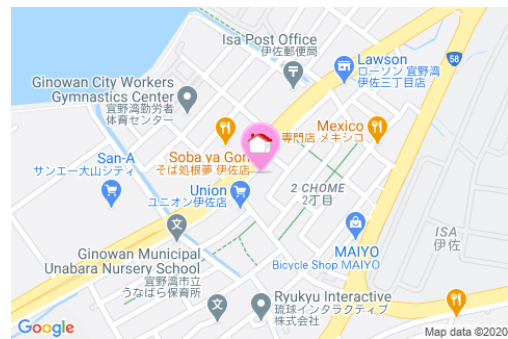
【バス停】市営伊佐住宅前／徒歩約1分