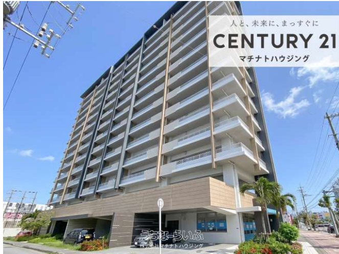
人と、未来に、まっすぐに CENTURY 21 マチナトハウジング

【13階から海と日の出を望む。専用ポーチと3面バルコニーが囲む、プライベート空間】2017年築 | 専有面積85平米+バルコニー50平米 | イオンスタイル隣接・生活施設が徒歩5分内に揃う | ペット可 | 空室になりました！