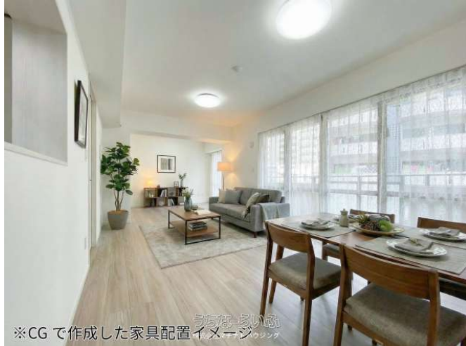
※CGで作成した家具配置イメージ