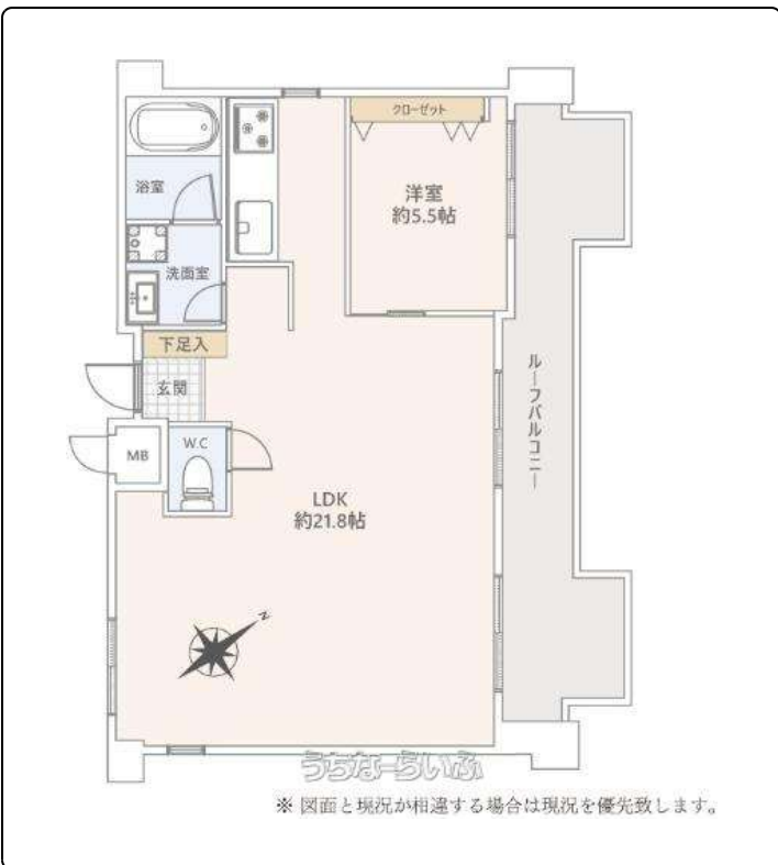
※ 図面と現況が相違する場合は現況を優先致します。

【リフォーム済み！即内覧可能！】最上階で眺望良好です！泊ふ頭まで徒歩5分で離島へのアクセスも良い物件 出ました!!お気軽にお問い合わせください!!