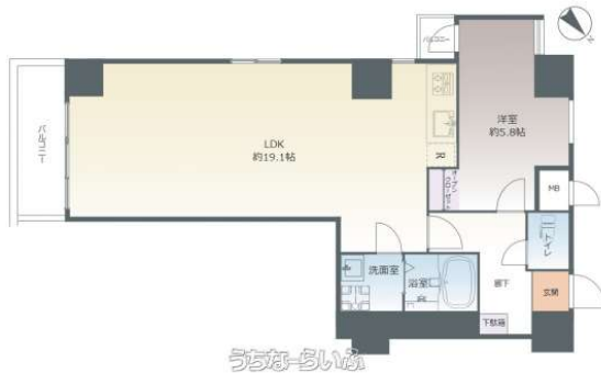
ライオンズマンション浮島通り 201号室