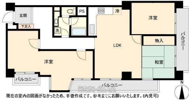
現在の室内の図画がなかったため、手書作成です。参考までをお願いいたします。(内見可)

【価格改定！2,480万円⇨2,399万円】国際通り付近に3LDKのお部屋出ました！観光地：国際通り 徒歩1分！セカンドハウスや収益物件としていかがですか！ゆいレール県庁前駅、徒歩5分！お気軽にお問い合わせ下さい！！