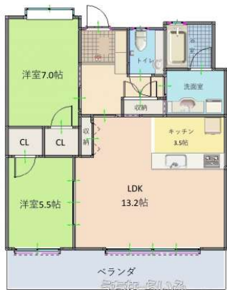
Tokurea rycom aqua terrace 503 ※現況と図面が異なる場合は、現況を優先します。

【オーナーチェンジ物件】賃貸中の収益物件です。【家賃収入20万円/(月)】イオンモールや、高速インターなども近く便利な立地です。近年人気のライカムエリアです！退去後は、自己使用も可能です。お気軽にお問い合わせください！