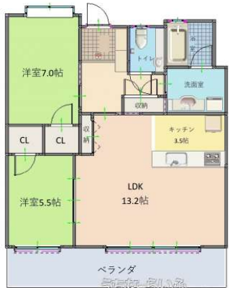
Tokurea rycom aqua terrace 503 ※現況と図面が異なる場合は、現況を優先します。

【オーナーチェンジ物件】賃貸中の収益物件です。【家賃収入20万円/(月)】イオンモールや、高速インターなども近く便利な立地です。近年人気のライカムエリアです！退去後は、自己使用も可能です。お気軽にお問い合わせください！