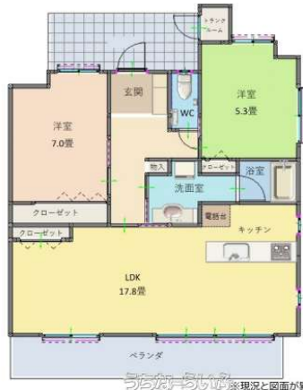
(ベアーズコート美浜A203)