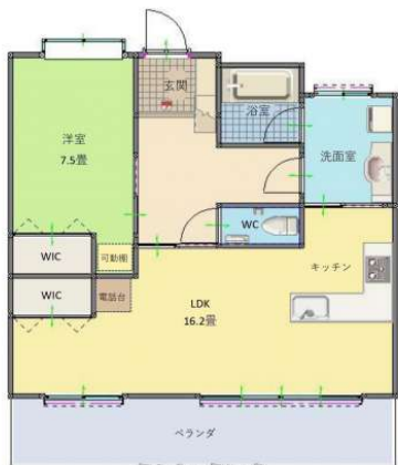
(ベアーズコート美浜#8806) ※現況と図面が異なる場合は、現況を優先します。

※価格調整しました！オーナーチェンジ物件☆賃貸中の収益物件です。家賃収入162,000円/(月)。オ ーシャンビューマンション。退去後は自己使用も可能です。お気軽にお問い合わせください。