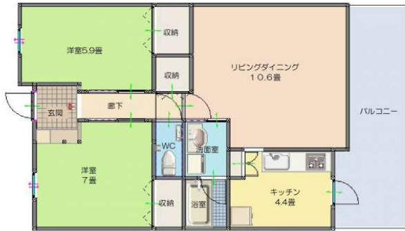
(コンフォート宜野湾オーシャンビュー602号室)

<弊社売主、仲介手数料なし><オーナーチェンジ物件>家賃190,000円/(月)。オーシャンビュー& 徒歩1分で海岸線！築浅のマンションで、付近には商業施設が多数あり生活も便利な立地です。退去後は自己使用も可能です。