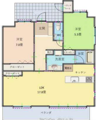
(ベアーズコート美浜A203) ※現況と図面が異なる場合は、現況を優先します。

【ベアーズコート美浜サンセット】オーシャンビュー！ポートビュー！サンセットビュー！道を渡ればすぐ海♪ 海と空が広がる大きな窓のリビング！徒歩圏内には大型スーパーや飲食店、観光地もあり便利な立地です。人気の北谷エリアです☆1月中旬以降、内覧可能です。自己使用も可能ですし、収益物件として賃貸も可能です。