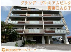
株式会社オールワーク

【わんぱつねこつと暮らせます】2025年9月リフォーム完了★徒歩約10分圏内にスーパーやコンビニ、お子様やワンちゃんとの散歩にも良い公園が揃う落ち着いた住環境に立地するマンションです★不動産のご購入・ご売却の相談はオールワークにお任せ下さい！