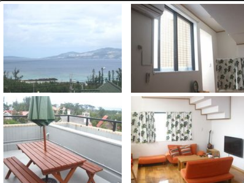
【バス停】伊武部希望ヶ丘入口 / 徒歩約7分