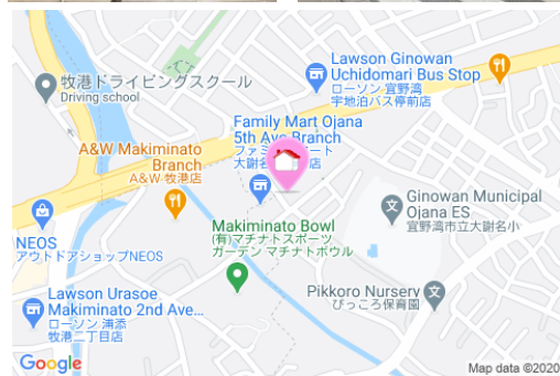
【バス停】宇地泊／徒歩約3分